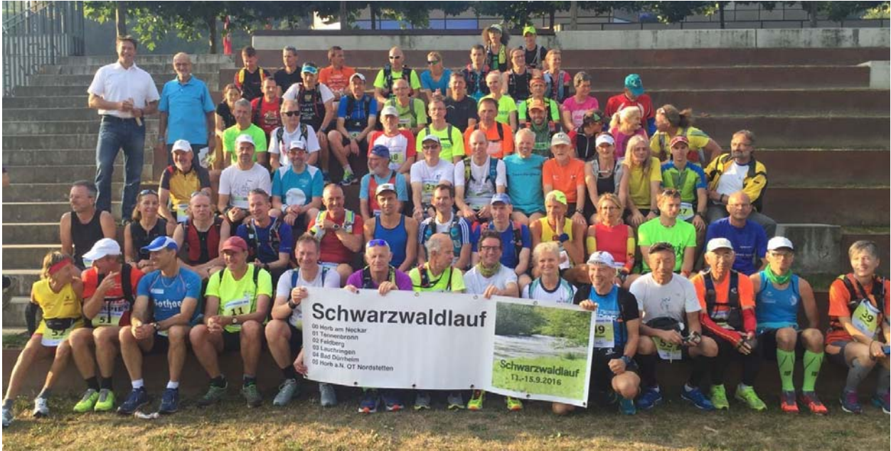
Gruppe der „Schwarzwaldläufer“